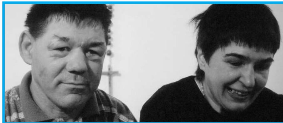
Ko bom jaz umrl, bo en majhen pogreb

Režija in scenarij: Florijan Skubic; Produkcija: AGRFT