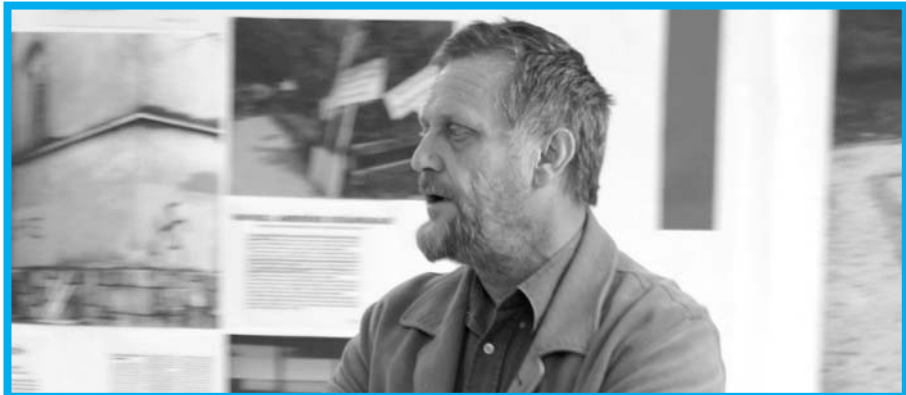
Matjaž Hanžek, varuh človekovih pravic.

To vlogo varuhu omogoča visoka stopnja ugleda, kredibilnost in zaupanje ljudi v institucijo varuha, ki si jo je pridobil v času svojega desetletnega delovanja, aktivnega posvečanja odnosom z javnostmi in pospešenega delovanja na področju promocije in izobraževanja za človekove pravice. Aktivno sodelovanje z različnimi javnostmi in povezovanje med državnimi institucijami in nevladnim sektorjem, univerzami, zasebnimi inštituti in drugo širšo strokovno in nestrokovno javnostjo mu je z leti ustvarilo tudi bogato socialno mrežo in s tem dostop do pomembnih informacij.