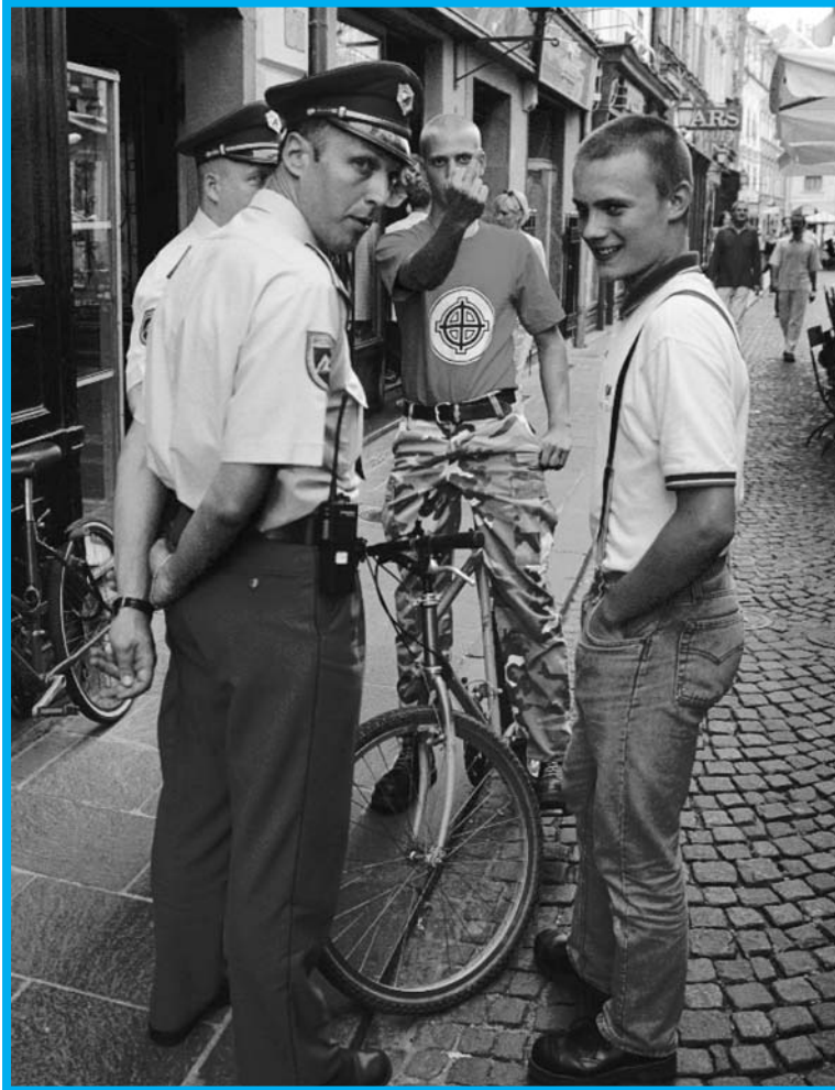
Vir: zložanka Jara kača nestrpnosti

Pri brskanju za informacijami o filmskih ustvarjalcih se je samodejno ustvarjala baza že narejenih filmskih del, ki so ali obravnavala človekove pravice ali so opozarjala na določen socialni kontekst, v katerem zlahka pride do kršenja pravic. Iz kopice je zlezla ideja, da bi širši javnosti prek že narejenih del predstavili tudi delo Varuha človekovih pravic.