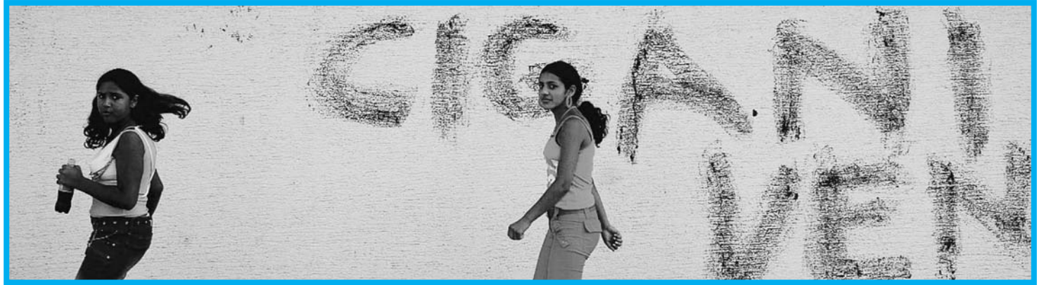
Iz filma V tranzitu

Čeprav gre vedno za zelo osebno izpoved, se moramo vendarle vedno vprašati tudi, komu kaj pripovedujemo in zakaj. Navsezadnje takle dokumentarni film ali televizijska oddaja nista zasebna spovednica ali psihijatrijska terapija, naj bi ne bila arena za brezobzirno osebno uveljavljanje, ne ring za zasebno obračunavanje! Posebne zadrege nastanejo pri snemanju ljudi.