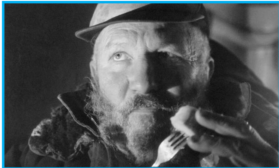
Selitev, Vir: Center za teatrologijo in filmologijo na AGRFT, Avtor: Jurij Gruden

Režija in scenarij: Jurij Gruden; Produkcija: AGRFT