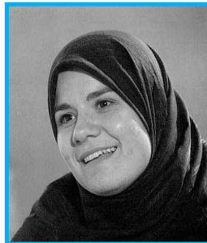
Alahu predane, Vir: www.film-sklad.si/html/festival2003/si/program/tv-produkcija/alahu-predane/

Režija in scenarij: Boštjan Mašera; Produkcija: RTV Slovenija (Verski program)