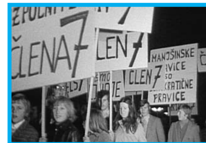
Člen 7: naša pravica! Vir: http://www.artikel7.at/index.php?Art_ID=15

Vsebina: Govori o položaju Slovencev na Avstrijskem Koroškem in politični zgodovini. Člen 7 - naša pravica! (Artikel 7 - Unser Recht!), ki smo ga lahko videli na letošnjem festivalu avstrijskega filma Diagonale, je informativen, tekoč, lucidno zmontiran in v televizijskem stilu posnet dokumentarec o problematiki koroških Slovencev, ki s pomočjo intervjujev - v glavnem koroških Slovencev, udeleženih v protestih iz sedemdesetih let prejšnjega stoletja - in številnih arhivskih posnetkov ORF in RTV Slovenije jasno pokaže, da je manjšinski problem na Koroškem nemogoče enostransko razložiti in da ga moramo obravnavati kot preplet zgodovinskih dejstev, anahronističnih vzgibov politikov in specifične politične situacije na Koroškem. (Večer, 25. 3. 2005)