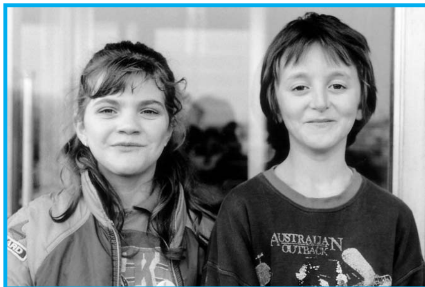
Iz filma V tranzitu