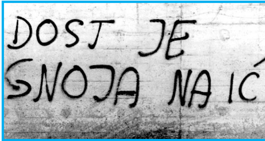
Vir: zloženka Jara kača nestrpnosti

Marina Gržinić, videoumetnica in filozofinja